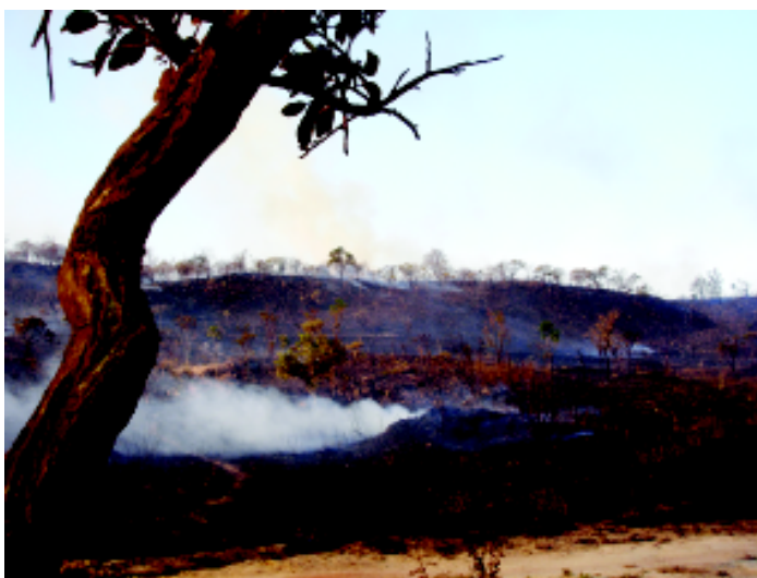
Vegetação e fauna nativas sofrem com as recorrentes queimadas

É interessante destacar que a escolha por uma determinada concepção de paisagismo irá influenciar fortemente em como e em quais quantidades serão utilizados os recursos que darão suporte ao modelo adotado. No que se refere ao uso da água