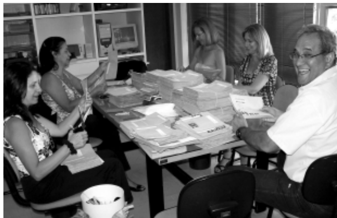
Apesar do árduo trabalho, a Comissão não perdeu o bom humor

A divulgação do resultado final e definitivo, com publicação no DOU e afixação na sede, será realizado no dia 29 de outubro e a posse dos novos conselheiros acontece no dia 11 de novembro de 2007.